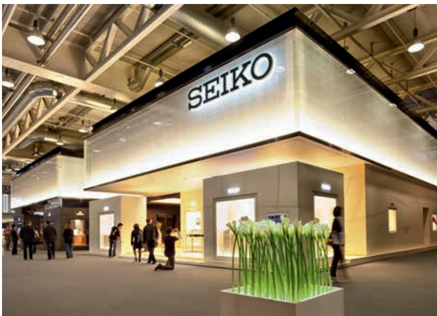
SEIKO, Baselworld, Basilea