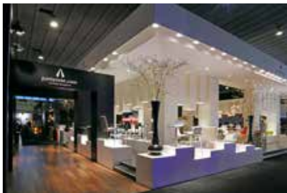
Party Rent Group, Best of Events, Dortmund

Nos encargamos de que su presentación en la feria esté a la altura de su marca y realizamos ideas espectaculares con calidad y rentabilidad. En la realización de stands feriales complejos, nuestros expertos están en situación de aportar todo su conocimiento y su experiencia.