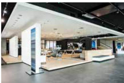
BMW Experience Center, Dielsdorf