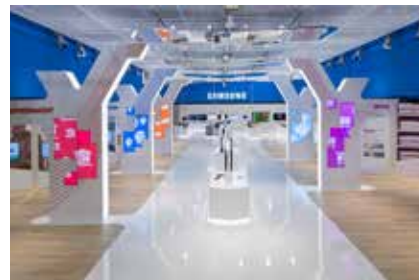
Samsung, CeBIT, Hanóver