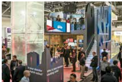
Schindler, Feria de Hanóver