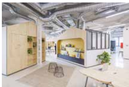
Offices MacCann World Group, Madrid