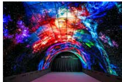
LG, IFA, Berlín