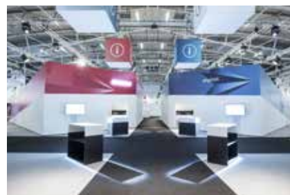
Audi Management Conference, Múnich