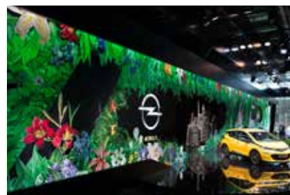
Opel, Salón internacional del automóvil, París