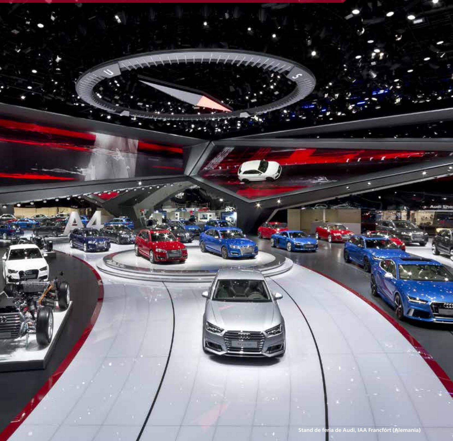
Stand de feria de Audi, IAA Francfórt (Alemania)

Arquitectura para grandes momentos de la firma