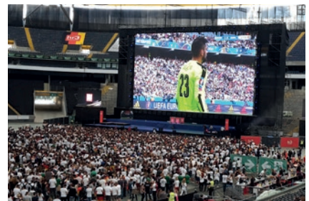
UEFA EURO, Public Viewing Frankfurt