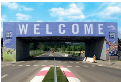
F1 Grosser Preis von Österreich, Spielberg