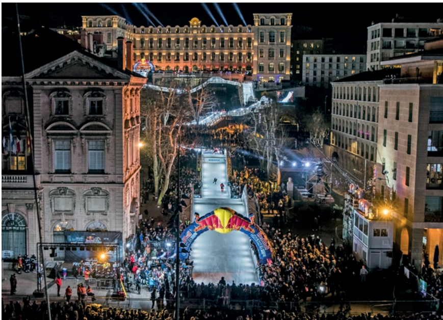
Red Bull Crashed Ice, Marseille