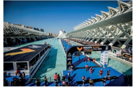
Maratón Valencia Trinidad Alfonso