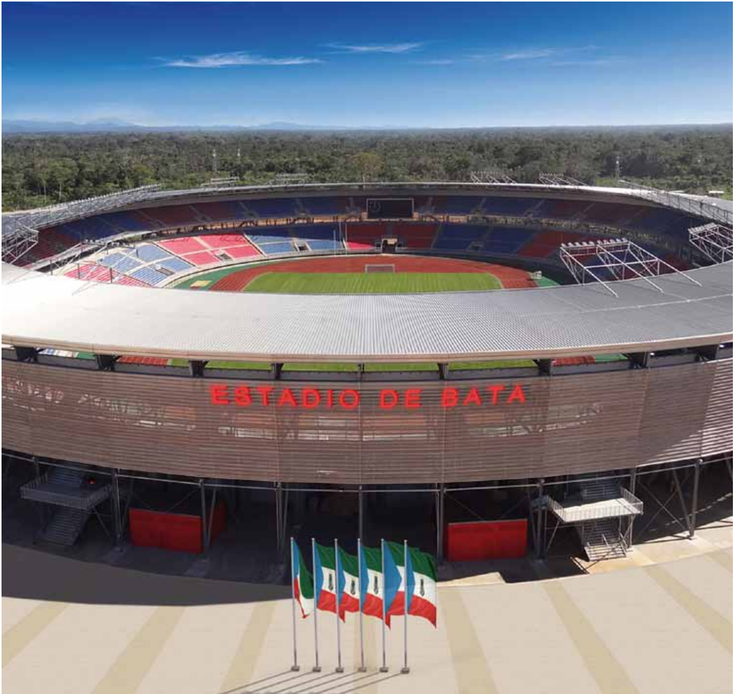
Modulares Stadion ® , Stadioneerweiterung