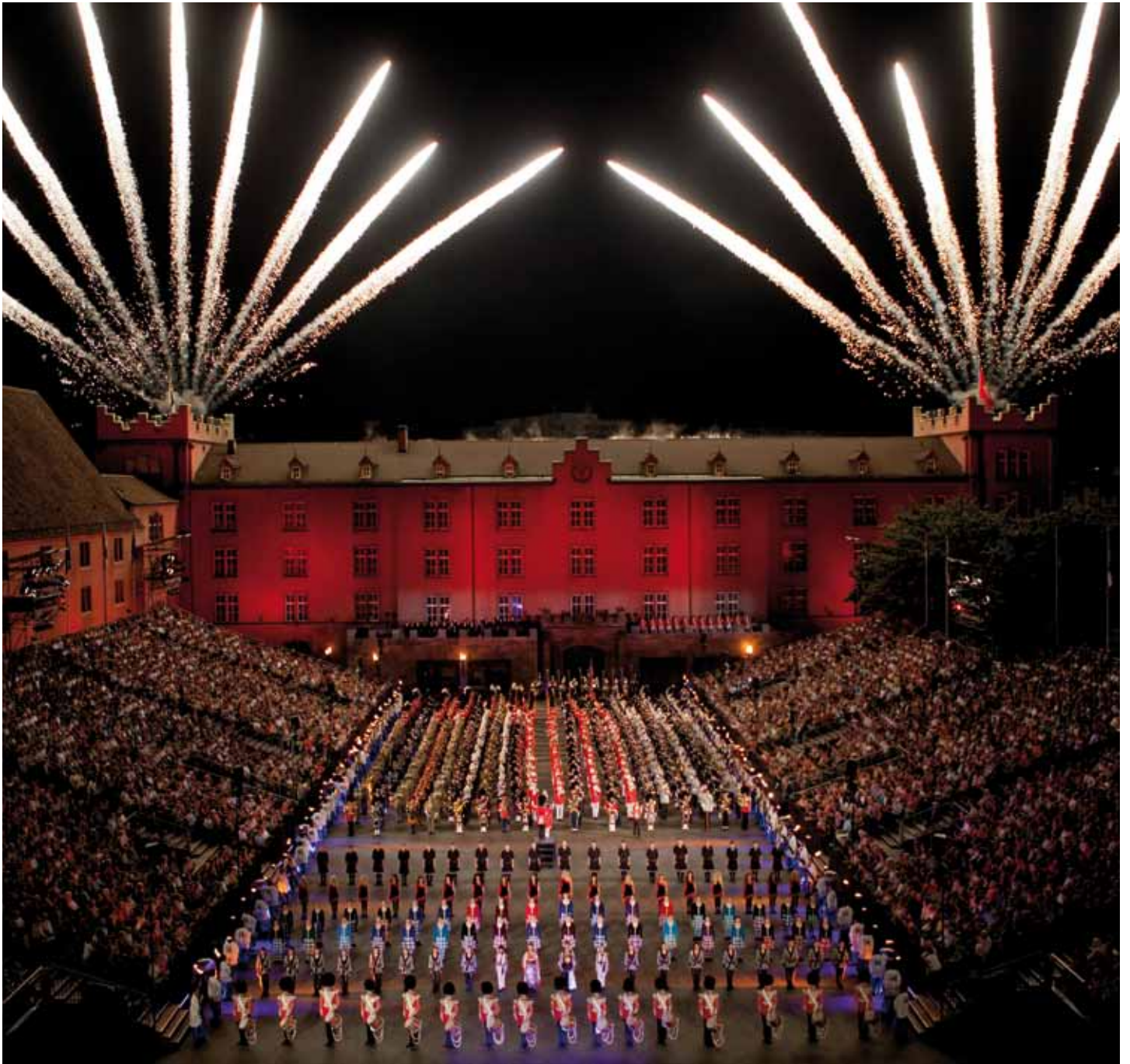
Tribünen, Bühnen, Sonderkonstruktionen