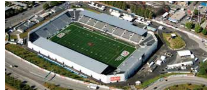
Empire Field Stadion 2010, Vancouver (CA)

Die Planung und die Montage von Tribünen und Bühnen sind eine unserer Kernkompetenzen. Dank ihrer Modularität und Vielseitigkeit ermöglichen unsere Tribünen- und Bühnensysteme verschiedenste Anwendungen. Die selbst entwickelten Bausysteme sind das Ergebnis aus jahrzehntelanger Erfahrung und Lösungskompetenz im Eventbau.