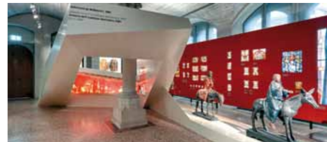
Ausstellung „Geschichte Schweiz“, Landesmuseum Zürich, Zürich (CH)