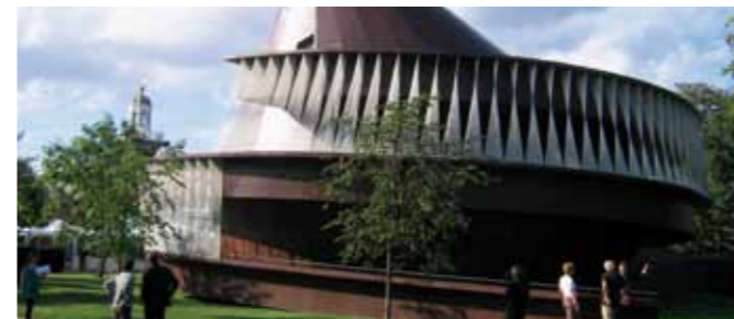
Serpentine Gallery Pavilion 2007, London (UK)