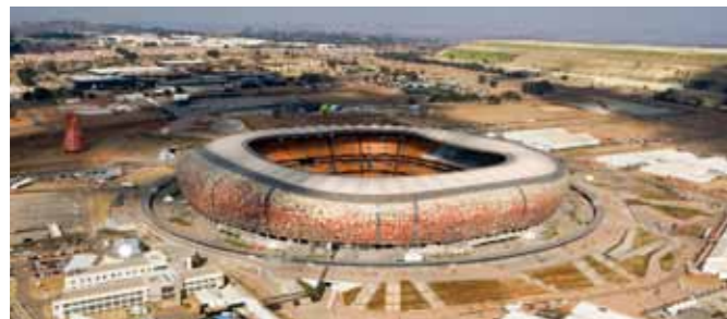
Soccer City, FIFA Fussball-Weltmeisterschaft 2010, Johannesburg (ZA)