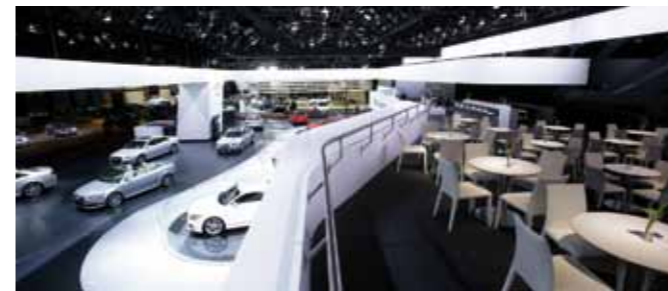
Audi Messestand, NAIAS 2009, Detroit (US)